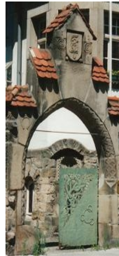
Eingang Parkstraße Karlsruhe

Tür des Himmels, letzter Fluchtweg, uns gezeigt zur Errettung der Seele.