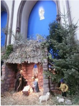
Krippe St.Bernhard Karlsruhe