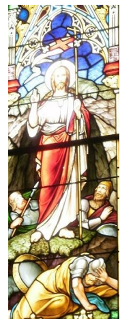
Auferstehungs- fenster in St. Matthäus, ev.- luth. Kirche, Kel- heim

Auferstehung, Alltag am Morgen: Glaube, der ewiges Leben verspricht.