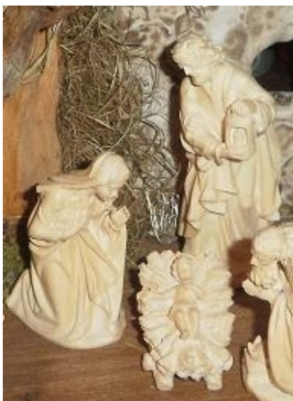
Allgäuer Holzkrippe, handgeschnitzt