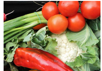
Früchte der Erde

Früchte entdecken, sie behutsam umsorgen und wachsen lassen in der Erkenntnis, dass Gott keinen vergisst.